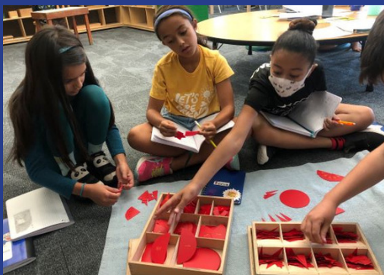
Students comparing fractions