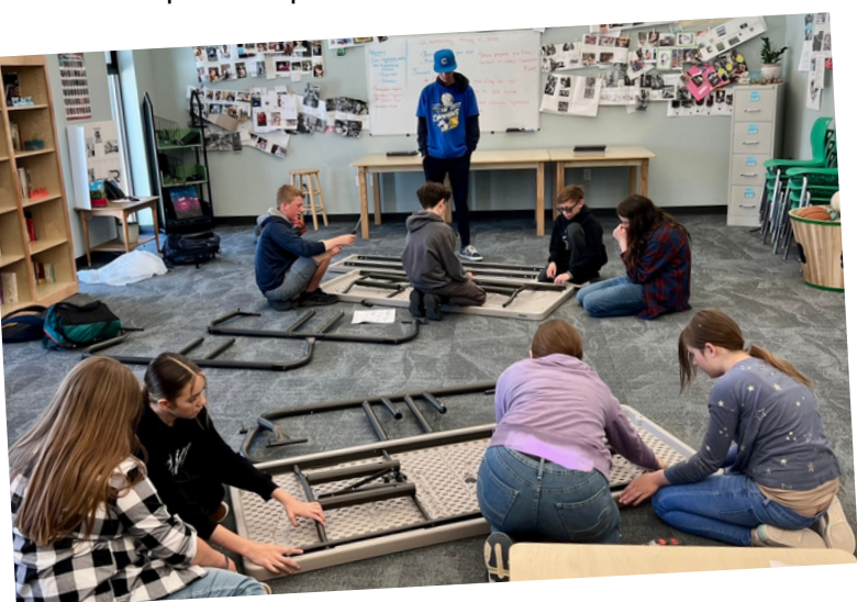
Proyectos comunitarios escolares: los alumnos montan mesas para nuestro espacio comunitario de la azotea.